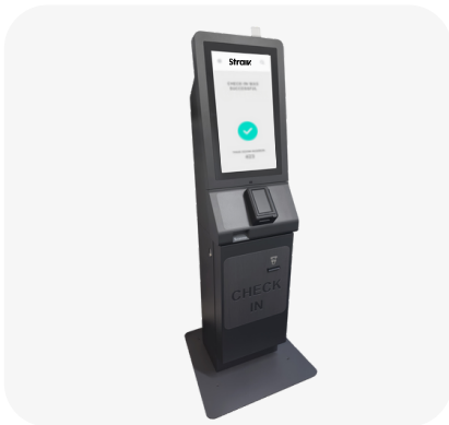
1 Indoor Kiosk