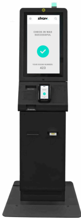
1 Indoor Kiosk